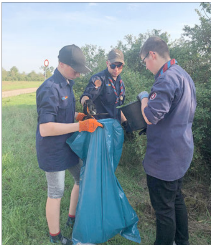
Nach Rücksprache mit der Gemeinde wurde der Müll durch uns an den Bauhof übergeben und dort ordentlich entsorgt. Wir haben uns vorgenommen in Zukunft öfter solche Müllsammelaktionen durchzuführen, um unseren ganz persönlichen Beitrag zum Umweltschutz zu leisten.